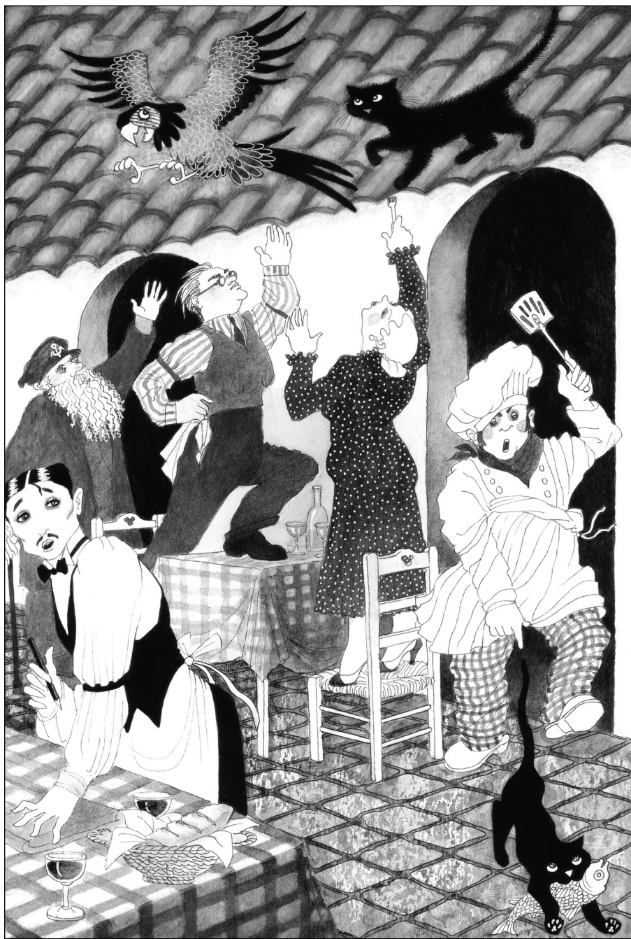
Η επιδρομή στην ψαροταβέρνα πήγε ρολόι.