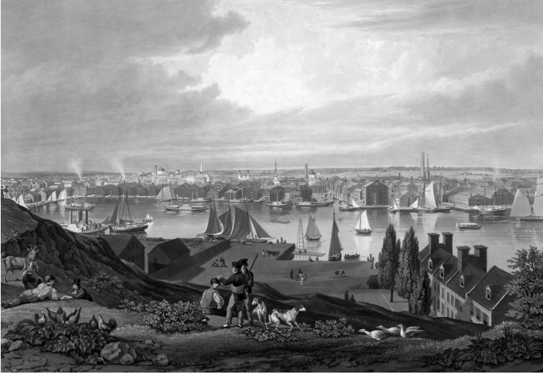
William James Bennett, Άποψη της Βαλτιμόρης από τον λόφο της Ομοσπονδίας, 1831.

σε να τα αξιοποιήσει όπως ήθελε. Ένας καλός διαγωνισμός παρείχε στα εβδομαδιαία έντυπα αφθονία κειμένων, τα οποία κάλυπταν την ύλη τους επί πολλές εβδομάδες. Το Courier δημοσίευε επί έναν ολόκληρο χρόνο ιστορίες που είχαν υποβληθεί στον διαγωνισμό, συχνά χρησιμοποιώντας τις ως κύρια άρθρα.